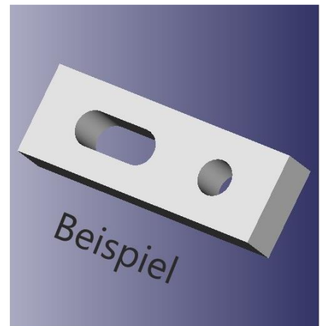
Eigene Lösung gefällig?